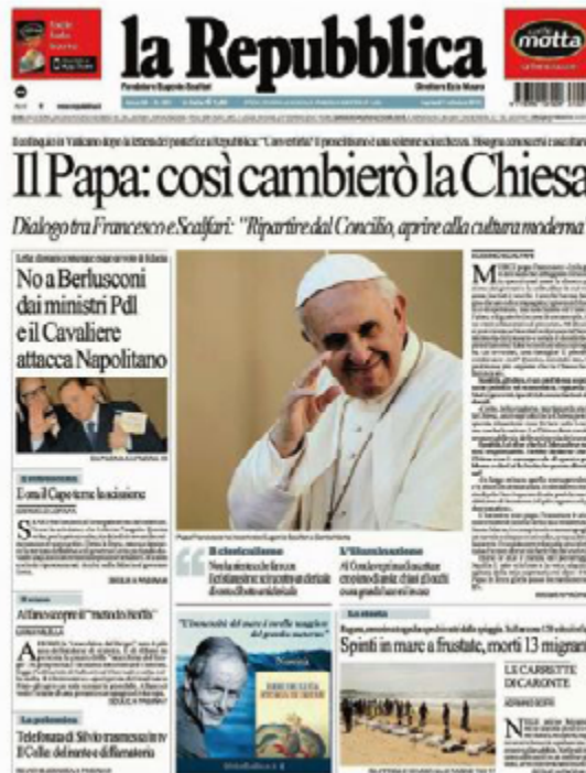
Entrevistas añaden nuevas confusiones

Al ser entrevistado durante el vuelo de regreso de Río,