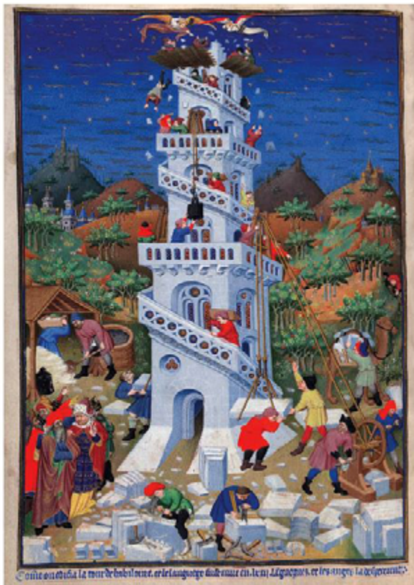
Representación medieval de la Torre de Babel

Mientras los movimientos progresistas y socialistas se arrastraban para atender a la “última llamada” que significó el nuevo pontificado, calles y templos fueron siendo invadidos por los jóvenes que parecen buscar una situación anterior al Concilio Vaticano II y a mayo del ‘68. Los seminarios y conventos “modernos” entraron en vía de extinción. Pero los tradicionales, modelados en el estilo “constantiniano”, se llenaron, a veces hasta estar repletos. “The Economist”, constató que la “modernización” del catolicismo en Gran Bretaña hizo que los fieles abandonaran las iglesias, por lo demás con un clero cada vez más escaso. Pero las misas en latín, con el sacerdote vuelto hacia Dios y de espaldas a los fie-