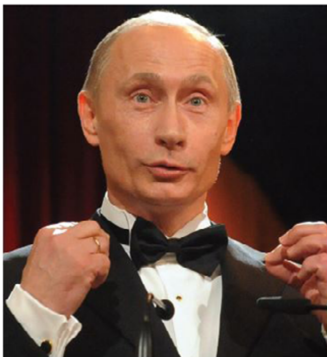
Vladimir Putin. El ex coronel del KGB

creció entre los políticos del Viejo Mundo: la perspectiva de un auge de voto anti-UE en las elecciones al Parlamento Europeo. El Episcopado francés amenazó actuar en contra de este voto, calificado de “extrema derecha”. En Cataluña, las tendencias separatistas están tratando de celebrar un referéndum a favor de la independencia, mientras que la familia real española, polo unificador de España, se ha venido desacreditando a causa de los escándalos financieros reportados con sesgo anti-monárquico por la prensa. Alemania mantuvo su posición de defensa de UE, contraria a su