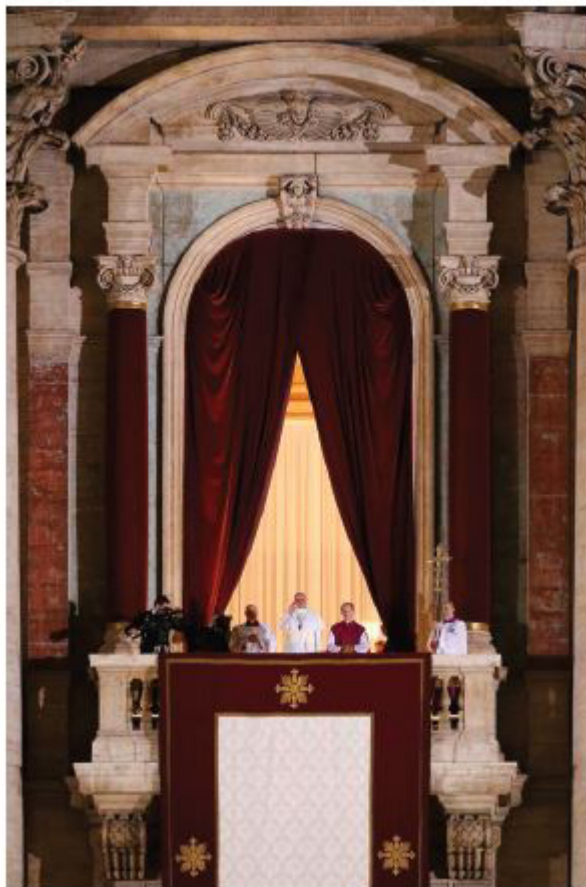
El nuevo Papa se inclinó y pidió a los presentes que rezaran por él

lugar de la presidencia. Desde entonces, no ha utilizado el coche especial reservado al Papa; recusó los apartamentos pontificios en el Palacio Apostólico y se instaló en el albergue eclesiástico Santa Marta, donde escoge al azar un lugar en las mesas para las comidas; abre las puertas a los visitantes; usa el ascensor común, y procede a otras simplificaciones, muy aplaudidas por la prensa. Además de casi no referirse a sí mismo como el Papa; adoptó una cruz pectoral de acero en vez de oro; un anillo del Pescador no de oro; y un nuevo báculo; dejó de usar el trono papal: la pequeña capa llamada mozzetta y los zapatos rojos; adoptó también una sotana de un blanco tenue, entre otras innovaciones simbólicas. (“Il Corriere della Sera”, 19/03/2013). Muchos recordaron entonces el Pacto de las Catacumbas , promovido por D. Hélder Cámara durante el Concilio Vaticano II, cuyos signatarios prometían renunciar a toda honra eclesiástica en aras de la igualdad y de la pobreza. La adhesión de nuevos obispos a ese pacto se realiza en ceremonias en la Catacumba de Domitila.