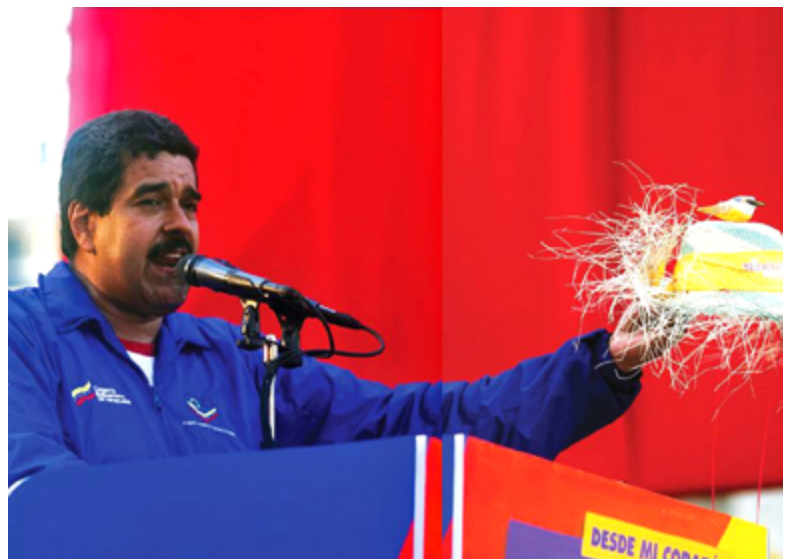
Nicolás Maduro, sobre cuyo sombrero el espíritu de Chávez es simbolizado por un pájaro de plástico.

Una farsa, no muy diferente a la que rodeó al cuerpo del dictador, presidió la ascensión de su sucesor, Nicolás Maduro, sobre cuyo sombrero el espíritu de Chávez, simbolizado por un pájaro de plástico, ¿continuaría siendo su fuente de inspiración! Al final del año, Maduro incitaba a las invasiones de tiendas y supermercados, así como a la lucha de clases. La desorganización social, política y ecow-