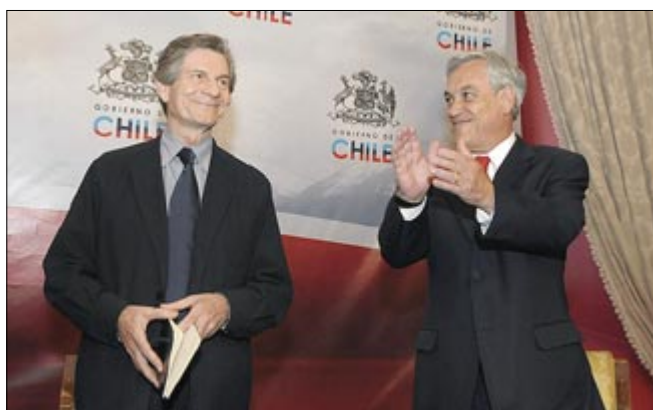
El economista y periodista pro-aborto Guy Sorman con el Presidente Piñera

Todas estas interrogantes parecieron explicarse con el reciente lanzamiento por parte del Ministro del Interior de lo que él llama la “Nueva Derecha”.