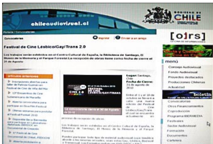
Página web del Consejo de la Cultura del Gobierno de Chile

Lamentable empecinamiento de un Gobierno que prometió defender la Familia.