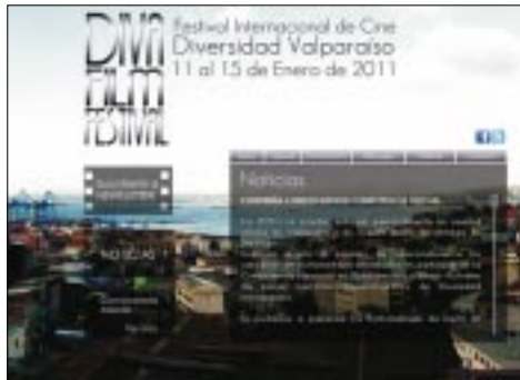
El Consejo de la Cultura también promueve el Festival Internacional de Cine Diversidad de Valparaíso, que se realizará en Enero de 2011, cuyo fin es "ser la principal plataforma nacional de exhibición de obras audiovisuales de temáticas ligadas a la diversidad sexual y de género".

¿Qué habría por detrás de una actitud tan contradictoria? ¿Por qué tanto empeño en auspiciar este Festival homosexual y en no dar explicaciones a los padres de familia? ¿Por qué quisieron hacer creer que la autoridad no tenía conocimiento del mismo y, sin embargo, una vez advertidos, mantuvieron el auspicio? Finalmente, ¿Qué les lleva a a continuar en ese camino, promoviendo un Festi-