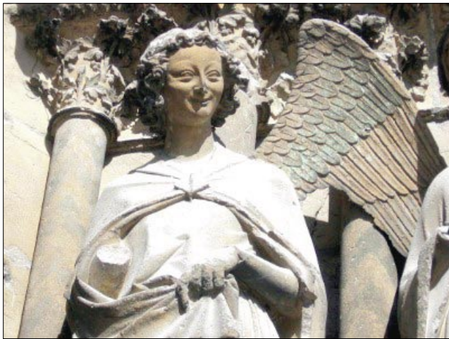
El Angel de la sonrisa - Catedral de Reims

Entre los millares y millares de puros espíritus que Dios había creado, mucho más numerosos que todos los mortales que existirán hasta el fin del mundo, ordenados en una inmensa jerarquía compuesta por nueve coros angélicos, se situaba en el último lugar. Todos los otros ángeles, sin excepción, estaban sobre él. Abajo, muy distantes, veníamos nosotros, los humanos.