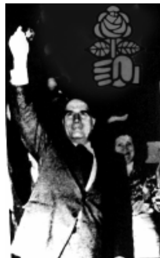
El fracaso de la autogestión de Mitterrand

Sin embargo, menos de un año después de ser elegido, él enterró el mismo proyecto, sin dar explicaciones a sus ardorosos seguidores del '68. En numerosas ocasiones la revista "Catolicismo" mostró el efecto decisivo que tuvo en esta abrupta marcha atrás el mensaje publicado en los principales órganos