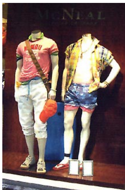
Modas del último verano europeo

Sin embargo uno de los argumentos que llevaron a Sarkozy a la presidencia de Francia fue precisamente la promesa - hoy brutalmente