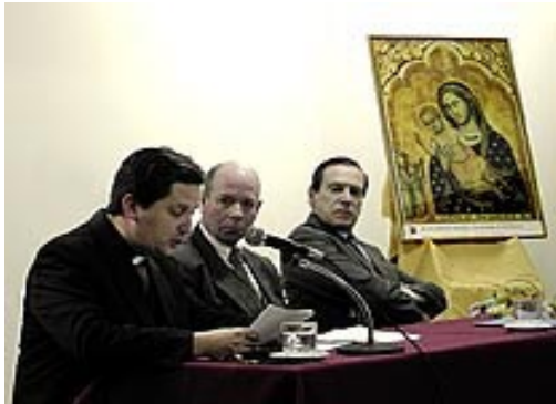
Aspecto de la Conferencia promovida por Acción Familia

El 24 de septiembre, Acción Familia envió una carta a todos los Obispos chilenos para manifestarles su "grave preocupación en relación a la amenaza que constituye para el futuro de la libertad de la Iglesia, así como para la pacífica convivencia nacional, la