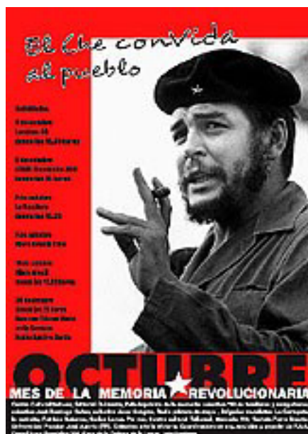
Poster del acto conmemorativo de la muerte de Ernesto "Che" Guevara

Por su parte la Conferencia Episcopal hizo una declaración en la que se afirma que “la violencia es el síntoma de una situación de inequidad evidente, que no ha sido resuelta por nuestra sociedad. Los trabajadores tienen el legítimo derecho de movilizarse a través de sus organizaciones representativas para